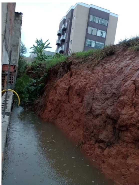
Nível da água durante chuvas.