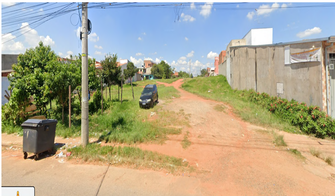
Rua Alcindo de Oliveira Rosa