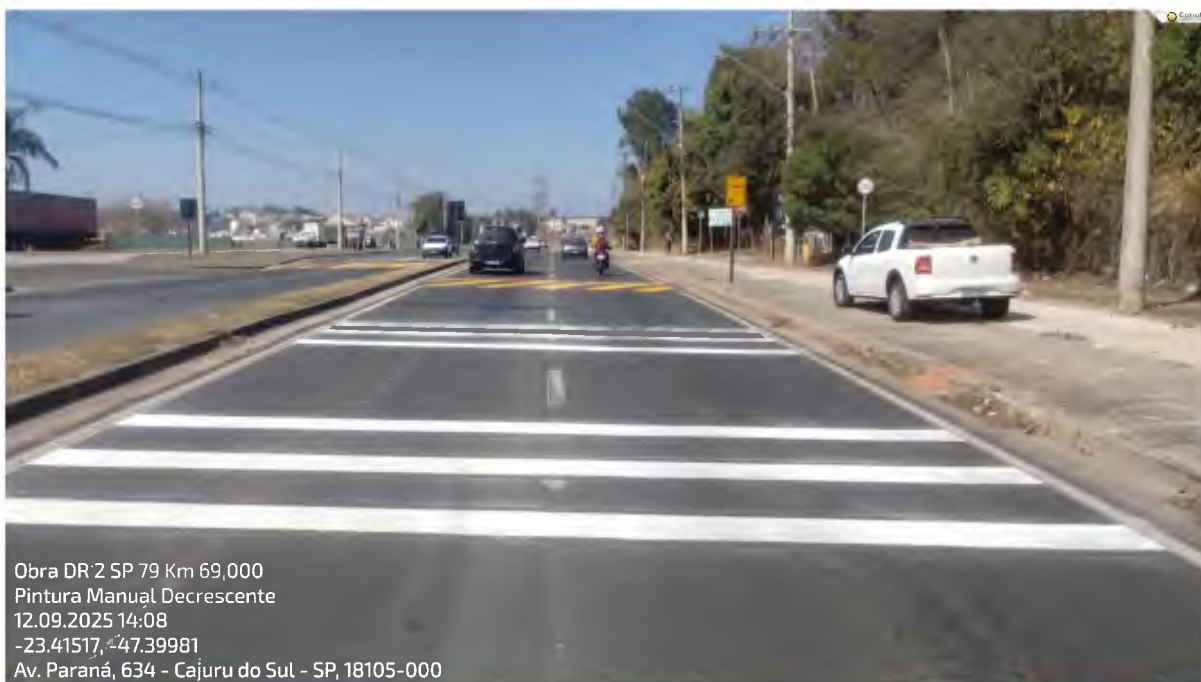
Obra DR 2 SP 79 Km 69,000 Pintura Manual Decrescente 12.09.2025 14:08 -23.41517, -47.39981 Av. Paraná, 634 - Cajuru do Sul - SP, 18105-000