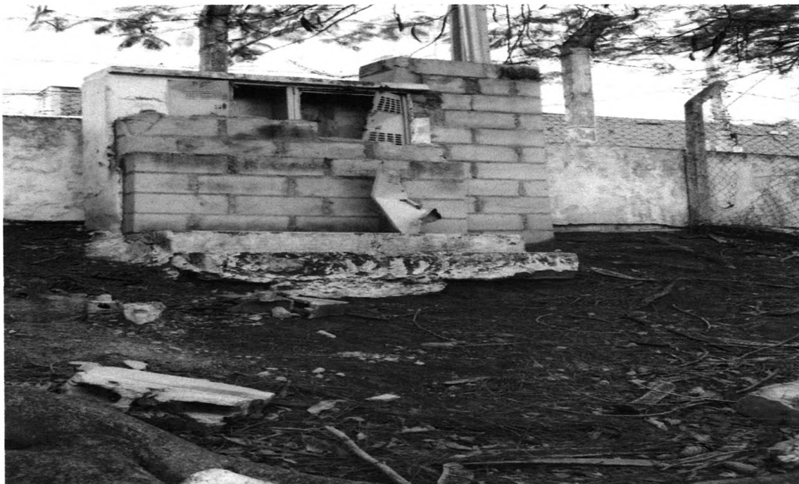
Falta de relógio de medição de energia que foi furtado