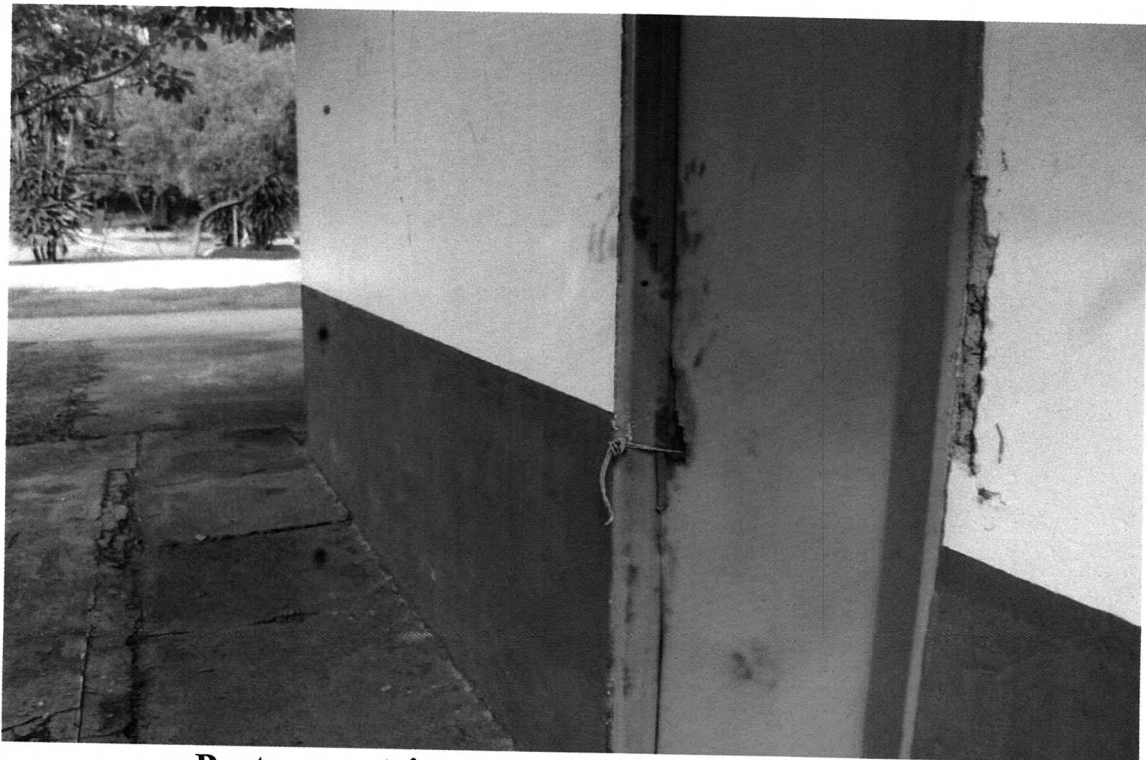
Portas sem trincos, completamente danificadas