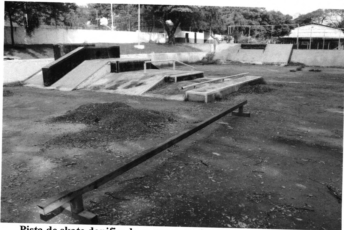
Pista de skate danificada e com resto de material de construção