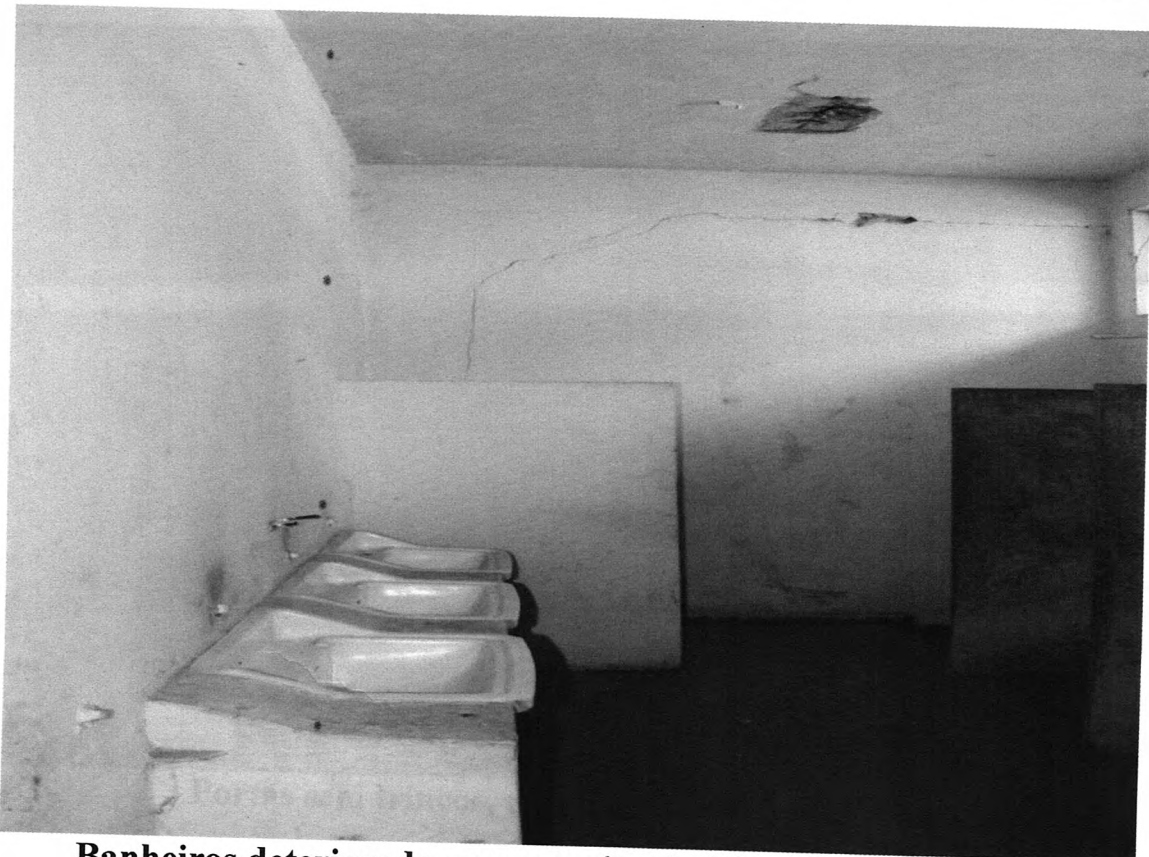
Banheiros deterioradose com muitas infiltrações e teto caindo