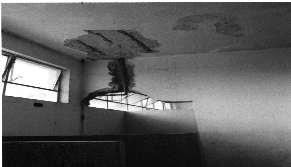
Queda de parte de teto e parede devido as infiltrações