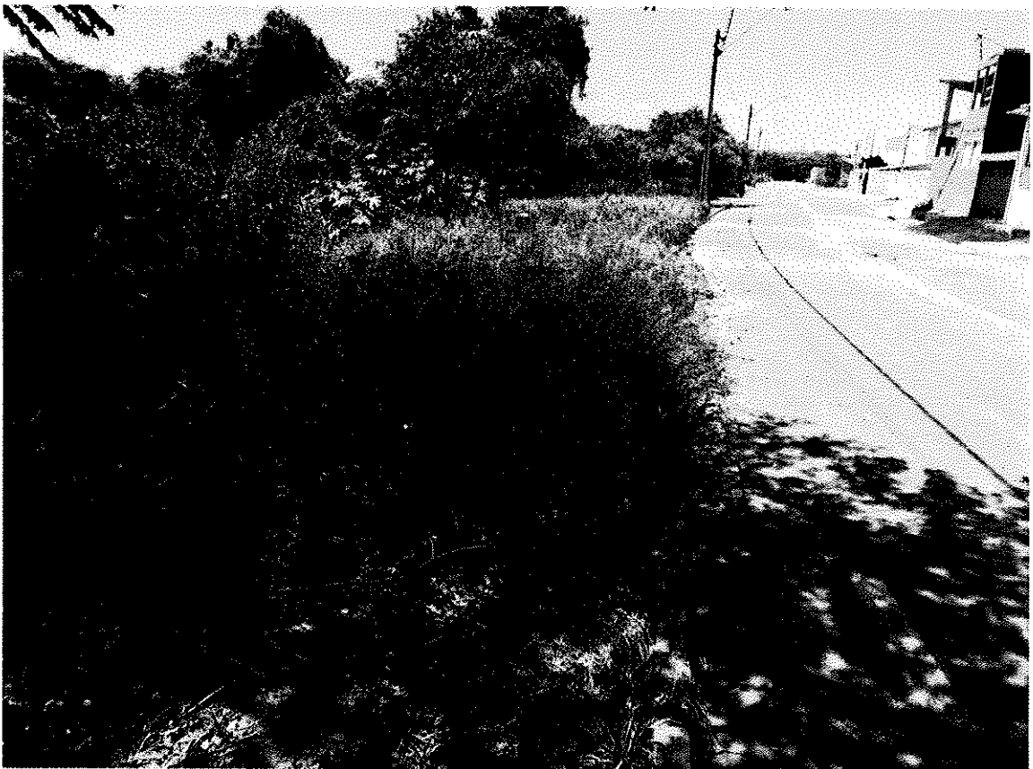
IMPLANTAÇÃO DE ACADEMIA AO AR LIVRE EM ESPAÇO FÍSICO CORRESPONDENTE A ÁREA PÚBLICA LOCALIZADA NA EXTENSÃO DA RUA OLYMPIA GIMENES, NO BAIRRO JARDIM DAS AZALÉIAS NO EDEN.