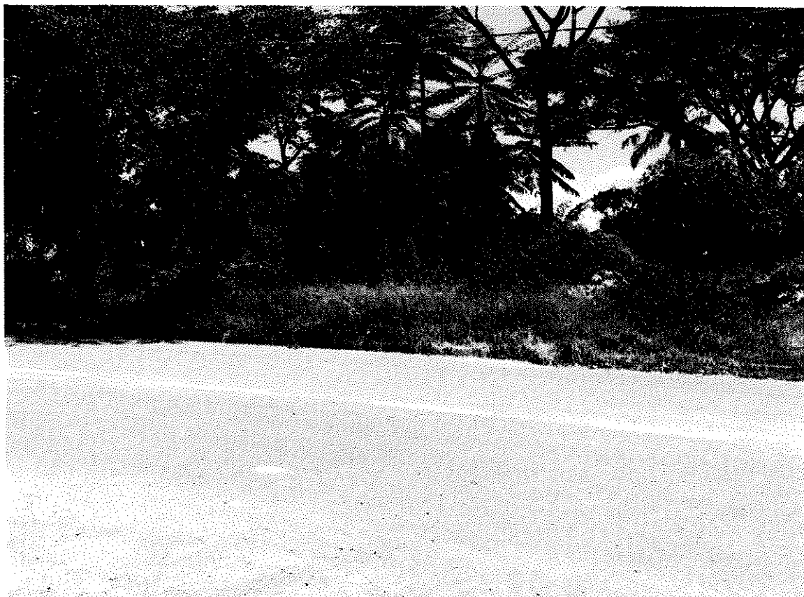
IMPLANTAÇÃO DE ACADEMIA AO AR LIVRE EM ESPAÇO FÍSICO CORRESPONDENTE A ÁREA PÚBLICA LOCALIZADA NA EXTENSÃO DA RUA OLYMPIA GIMENES, NO BAIRRO JARDIM DAS AZALÉIAS NO EDEN.