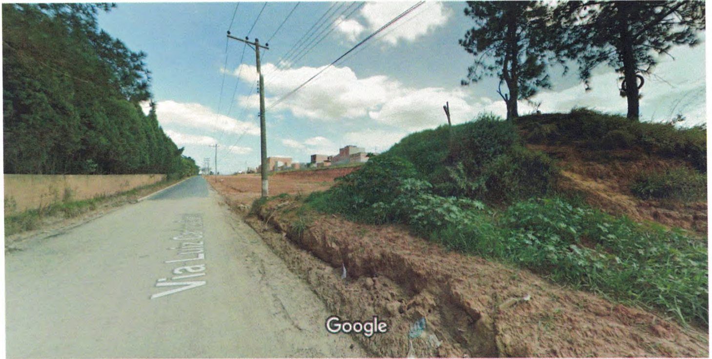
Captura da imagem: out 2013