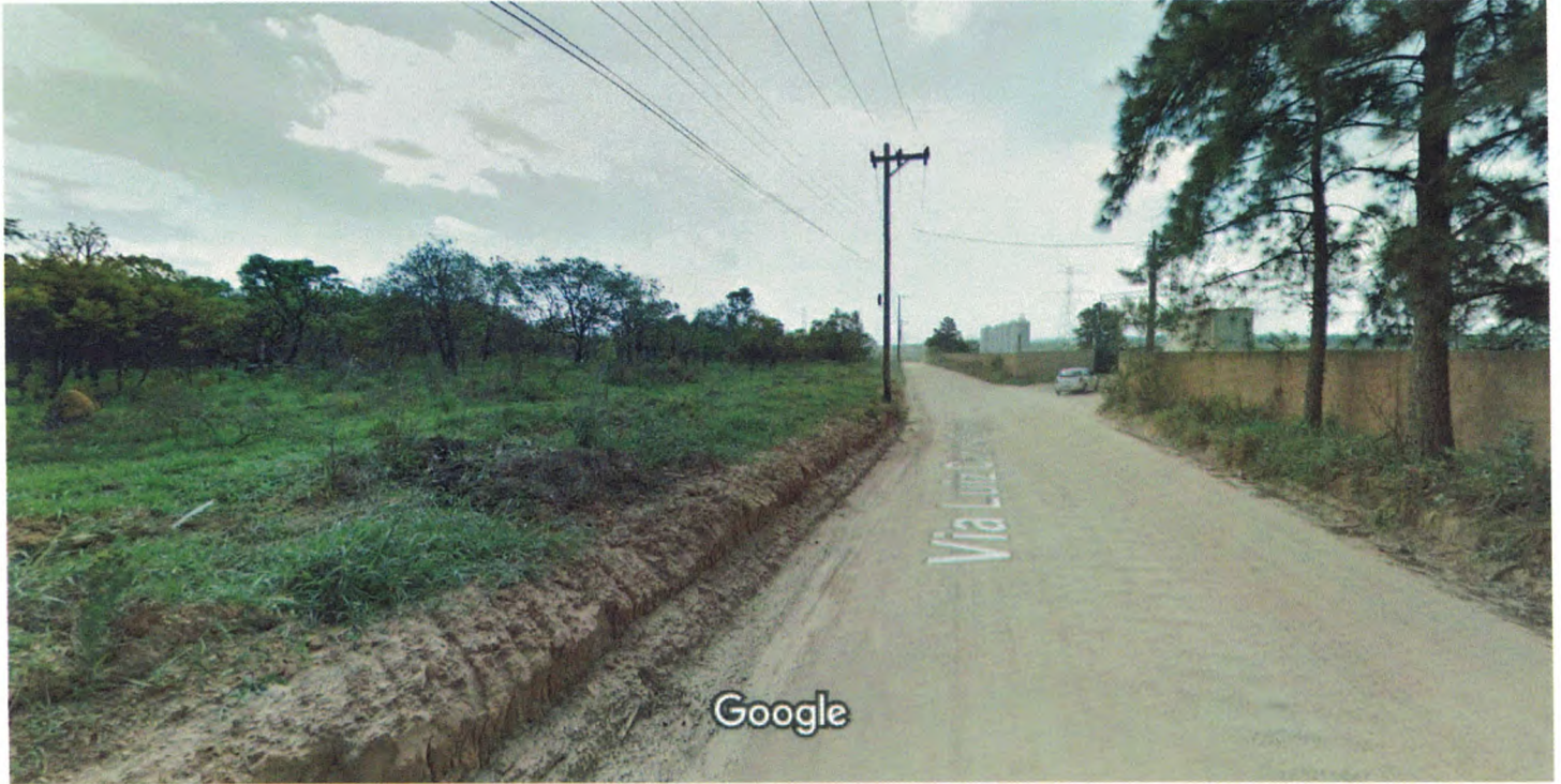
Captura da imagem: out 2013