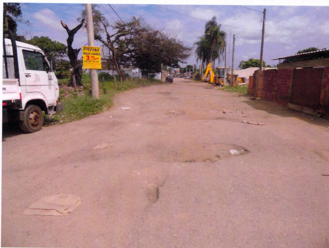
REVITALIZAÇÃO E RECAPE DA RUA SERAFIM DE SOUZA LOCALIZADA NO BAIRRO NOVA SOROCABA.