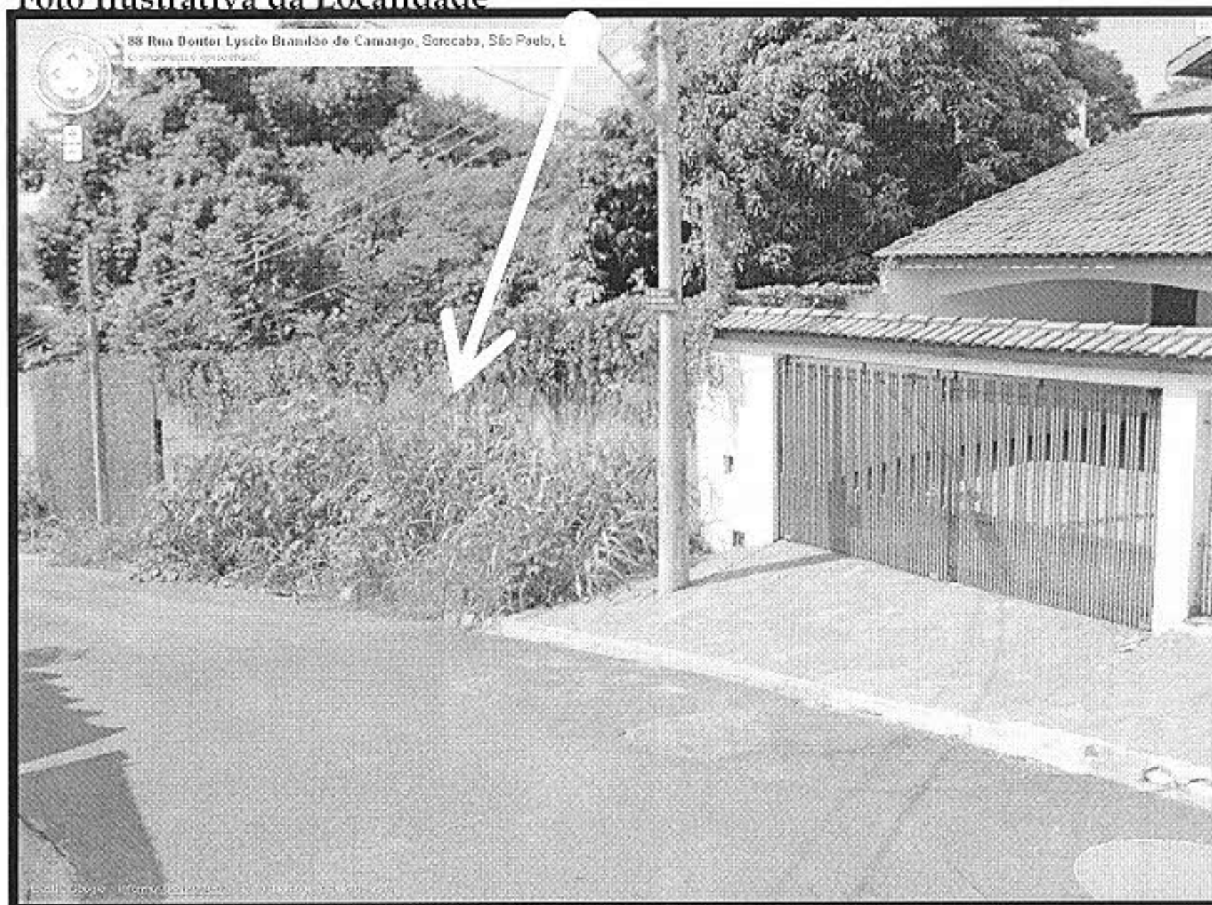
Foto Ilustrativa da Localidade