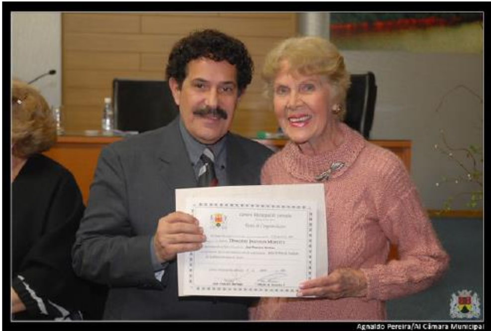
Agnaido Pereira/Al Câmara Municipal