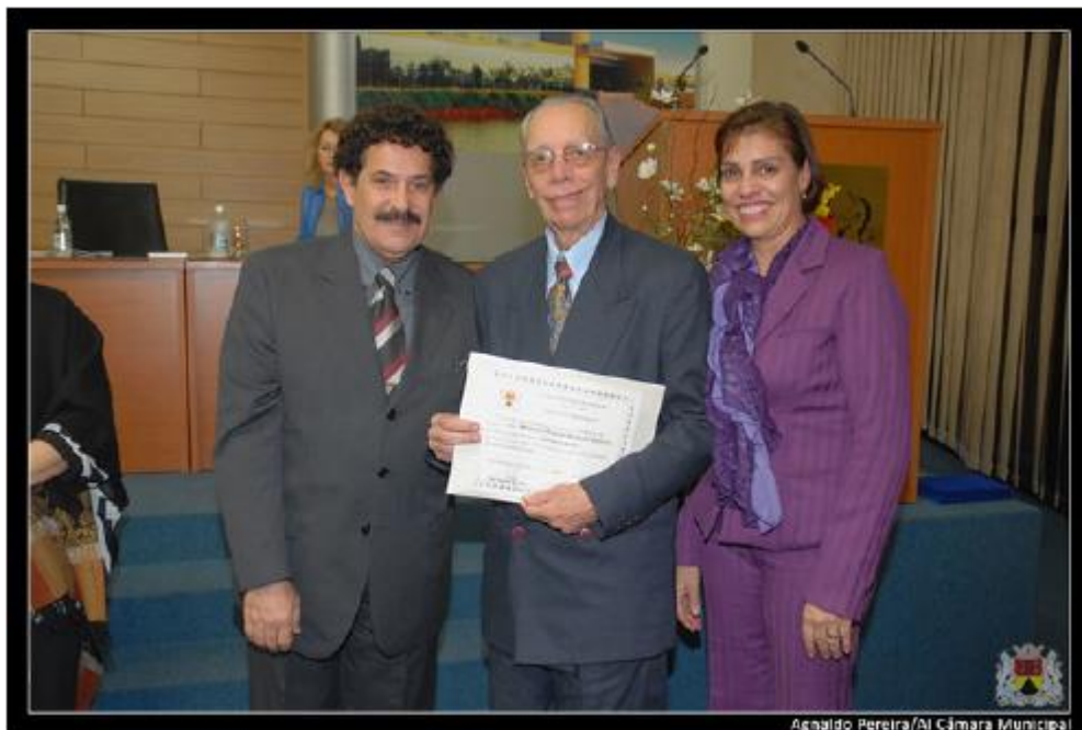
Agnaido Pereira/Al Câmara Municipal