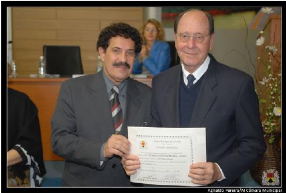
Agnaldo Pereira/Al Câmara Municipal