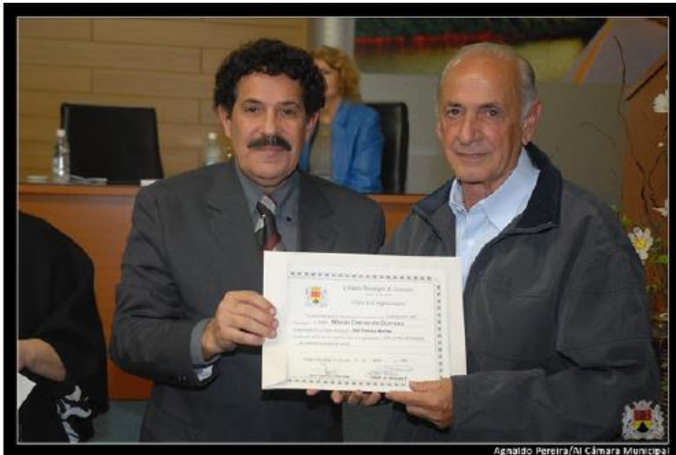
Agnaido Pereira/Al Câmara Municipal