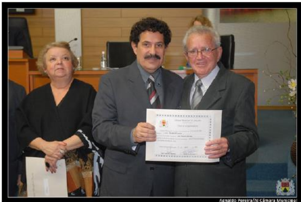
Agnaido Pereira/Al Câmara Municipal