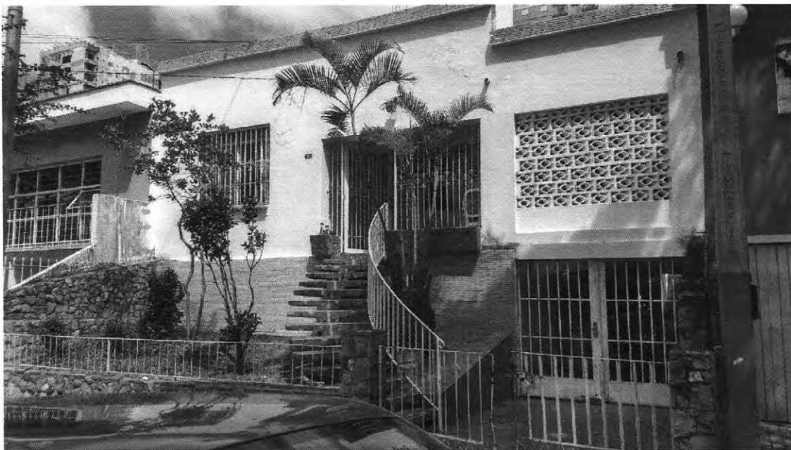
Fachada do Núcleo