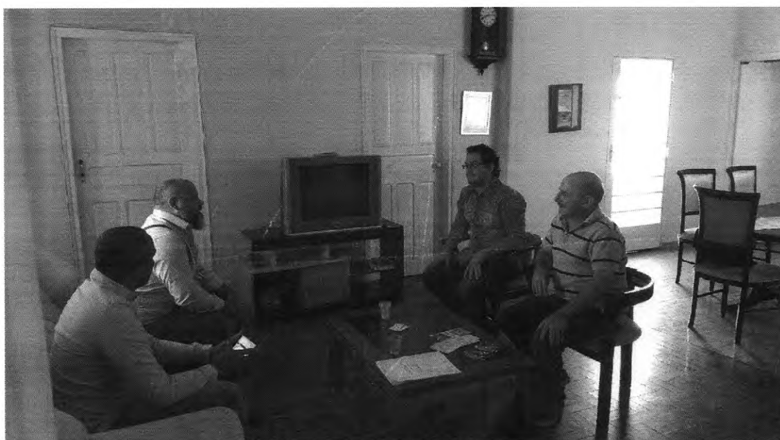
Interior do Núcleo