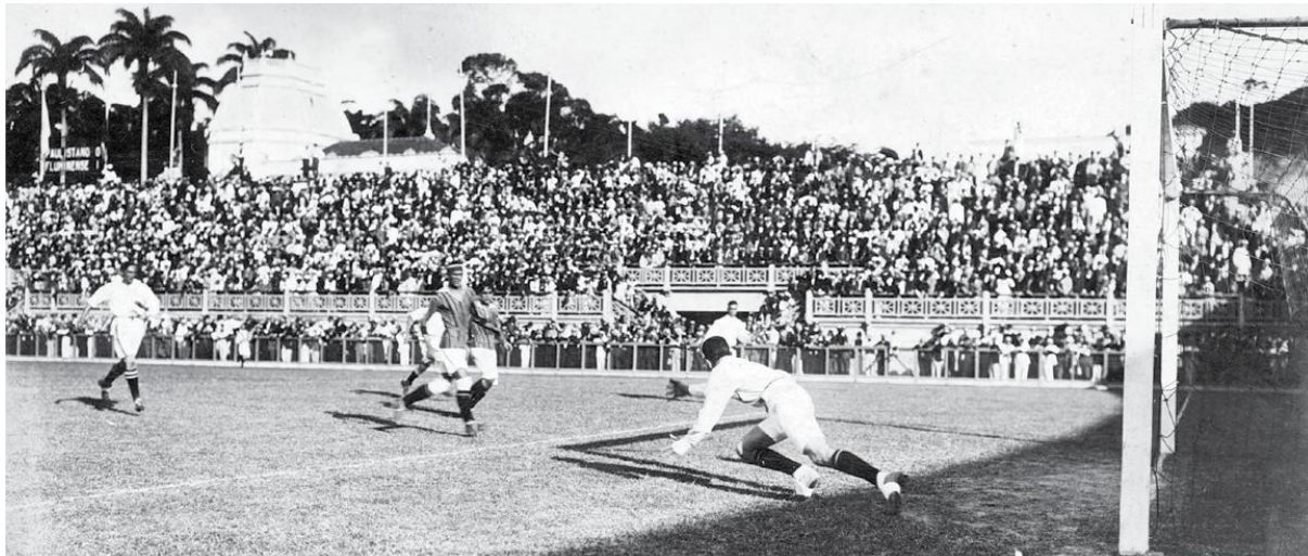
Torcida lotou arquibancadas para duelo entre Fluminense e Paulistano