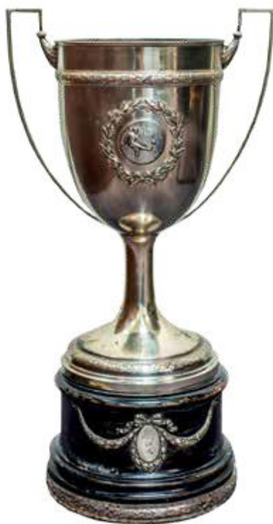
Taça Elixir de Nogueira – Campeão Brasileiro de 1920