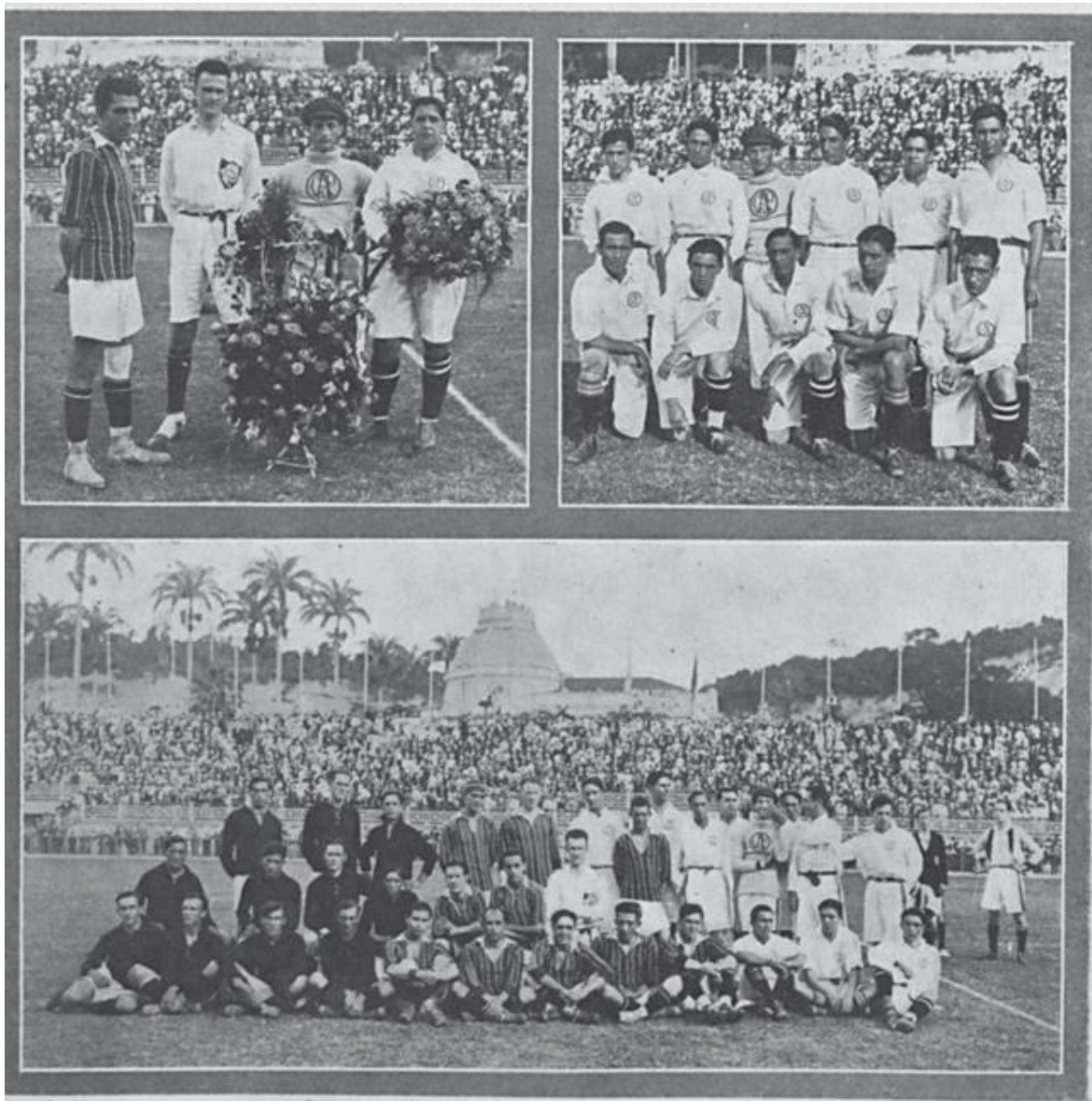
Imagens de Fluminense vs Paulistano, publicadas pela revista Careta