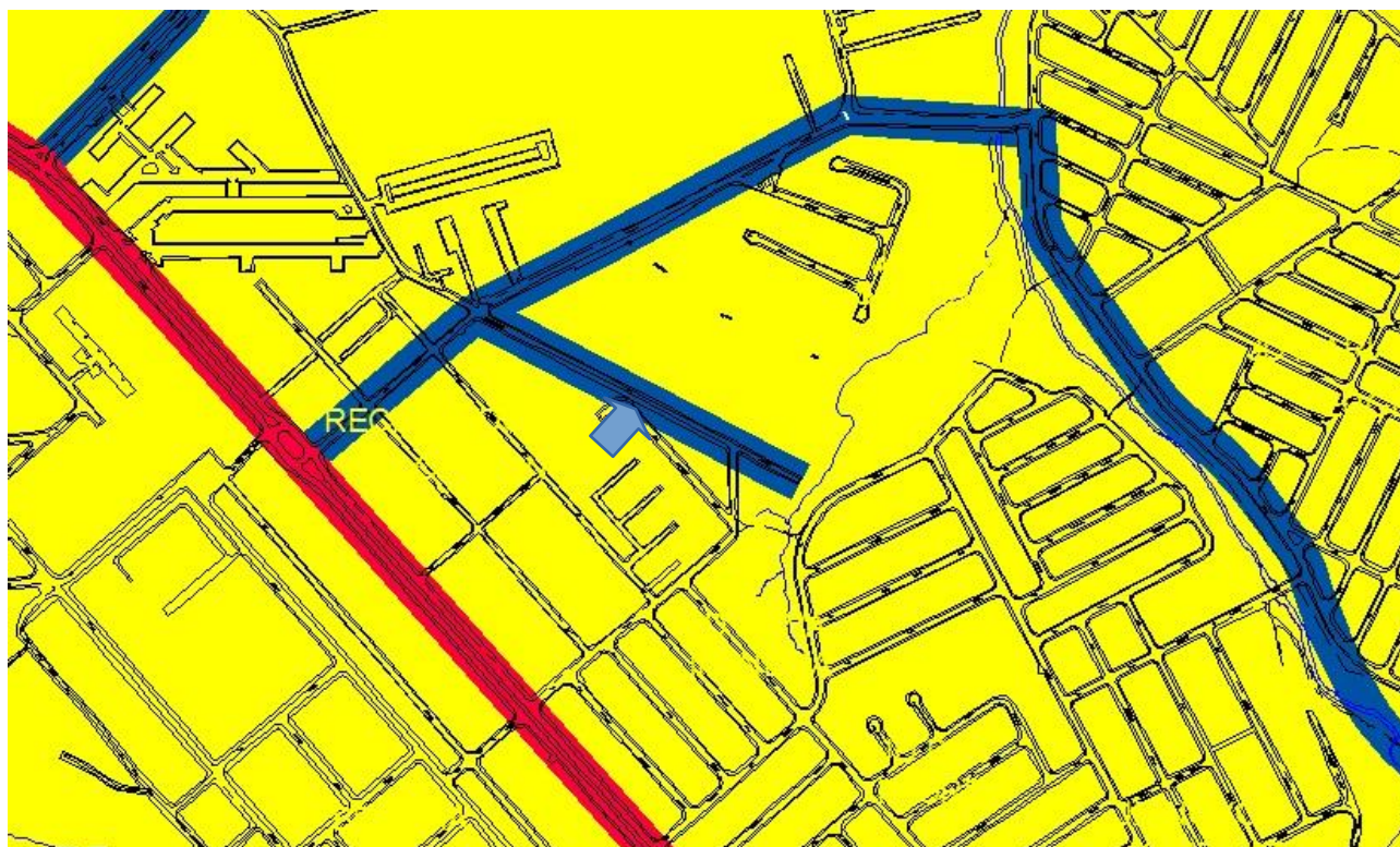
Imagem - 03:

Proposta protocolada, revisão Plano Diretor – 2024, MAPA-2 ZONEAMENTO, trecho da Estrada do Dinorah, na extensão a partir da Rua Seraphim Banietti até o final da via. Não há classificação uso como corredor de comércio e serviços.