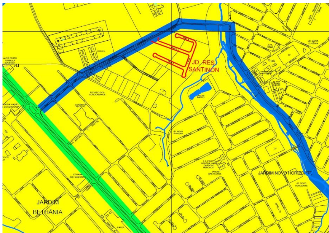
Imagem – 01:

Situação atual, Plano Diretor – 2014, MAPA-2 ZONEAMENTO, trecho da Estrada do Dinorah, na extensão a partir da Rua Seraphim Banietti até o final da via. Não há classificação uso como corredor de comércio e serviços.