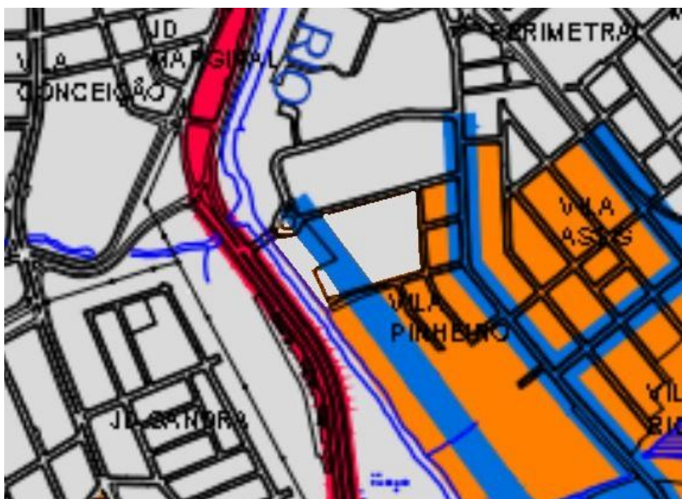
Mapa 2 - Zoneamento Urbano com a alteração proposta. (fig. 2)

A presente Emenda propõe uma mudança do perímetro da Zona Central (ZC), para que seja incluída a área localizada entre a Rua Conselheiro João Alfredo, a Rua Marcelio Dias, a Rua Silva Jardim e a Av. Juvenal de Campos (fig. 2 e fig. 3):