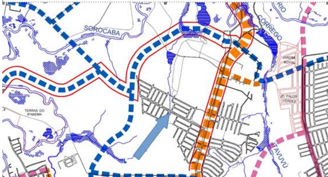
Imagem – 02:

Na proposta protocolada pelo PL 297/2024, projeto de revisão Plano Diretor 2024, o MAPA-03 (SISTEMA VIÁRIO PRINCIPAL), está disposto o trecho da Avenida Chico Xavier, como via implantada sem classificação de transporte coletivo.