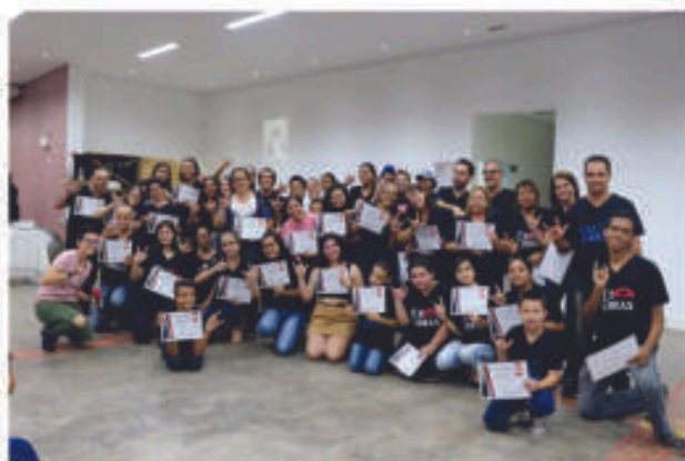
Formatura 2018 do curso de Inglês do Espaço Cultural dos Rodoviários de Sorocaba.