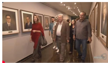
Informe SP 1ª Edição AO VIVO - 03/07/2024 Alesp

https://www.youtube.com/live/gytIzGObwfk?si=KolFTgMi_cD-qRBk