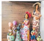
Exposição de Renda Filé, destacando a beleza do artesanato nordestino

Exposição de Renda Filé, destacando a beleza do artesanato nordestino. A exposição apresenta uma coleção de peças em renda filé, uma técnica tradicional de bordado. As peças são exibidas em um ambiente decorado com elementos da cultura nordestina. A exposição é gratuita e aberta ao público.