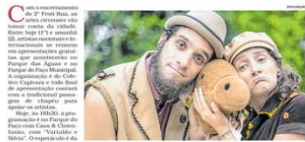
Festil Rua acontece nos parques das Águas e do Poço. Entrada é gratuita

Com o espetáculo "Festil Rua", os parques das Águas e do Poço recebem, no final de semana, uma programação especial com apresentações circenses gratuitas. O espetáculo é realizado nos parques das Águas e do Poço, com entrada gratuita. A programação inclui apresentações de teatro, dança, música e artes. O espetáculo é realizado nos parques das Águas e do Poço, com entrada gratuita.